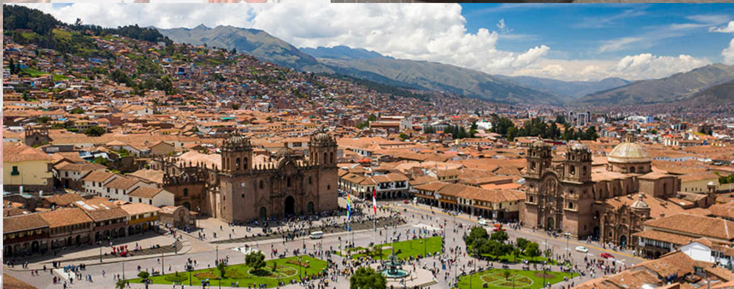
Plaza de armas Cuzco (Aucaypata)