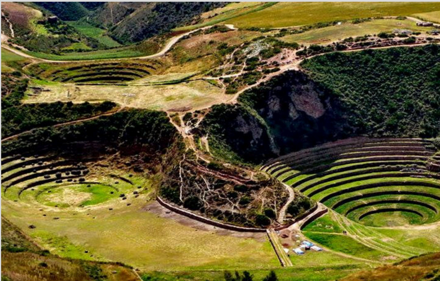
PARQUE ARQUEOLÓGICO DE MORAY