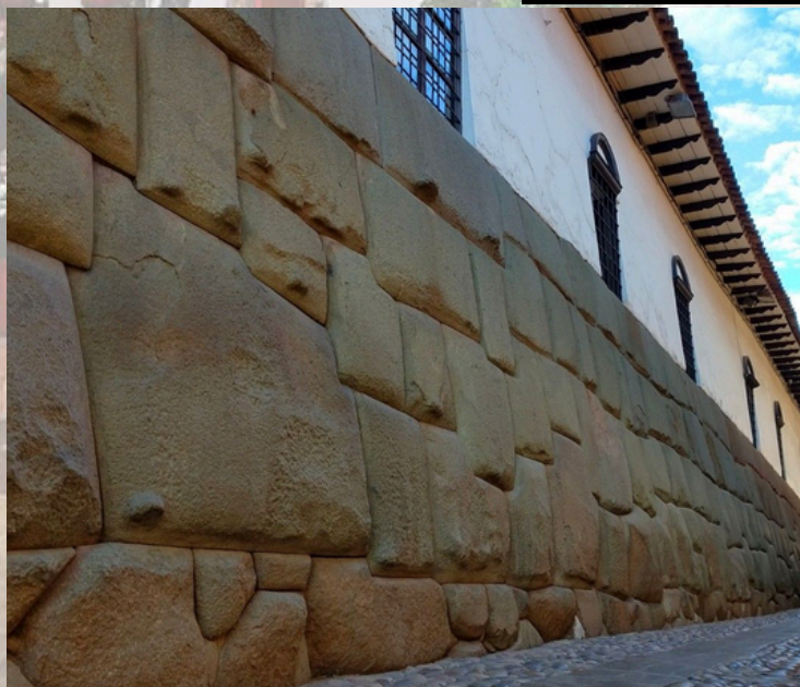
Calle Hatunrumiyoc (Piedra de los 12 Angulos)