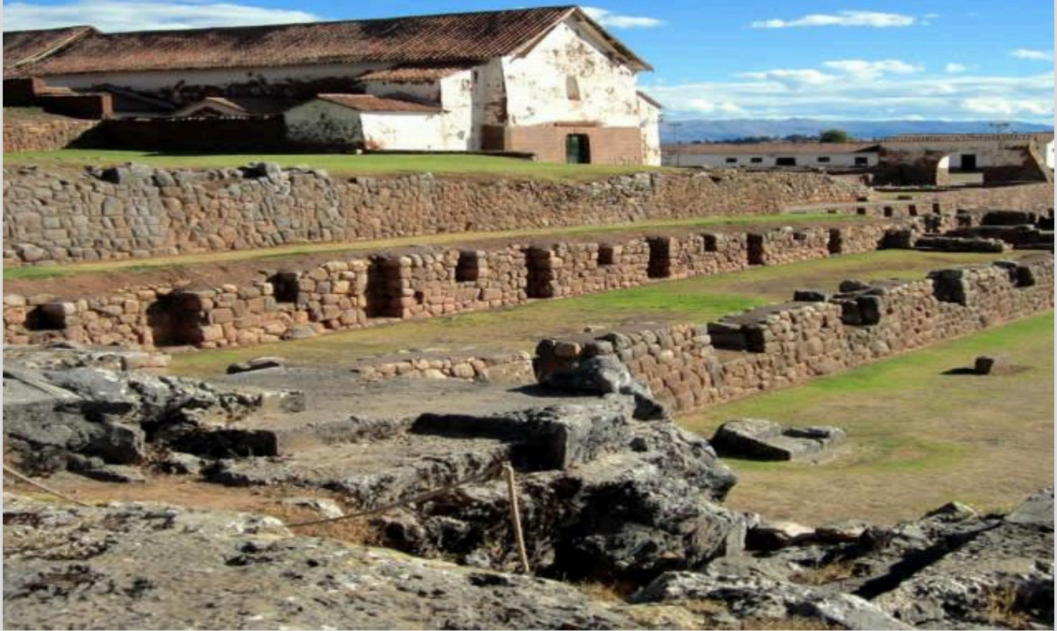
PARQUE ARQUEOLÓGICO DE CHINCHERO