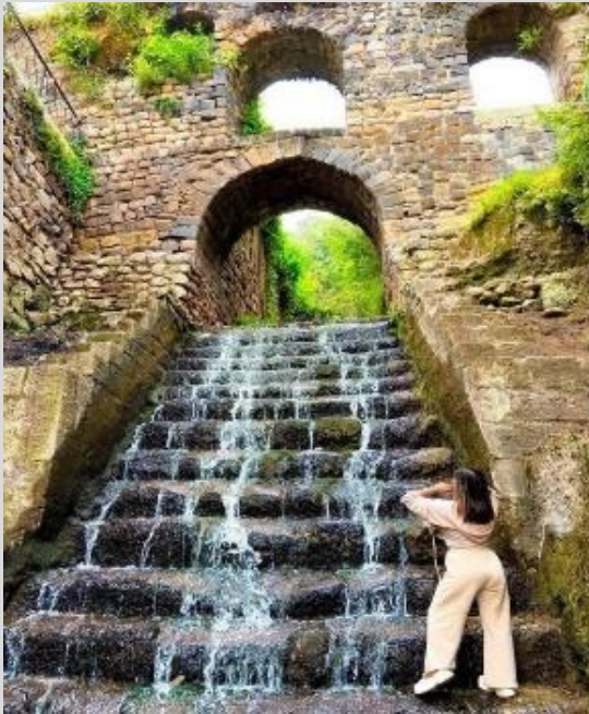
Apu Saphantiana (Acueducto colonial) Calle 7 borreguitos