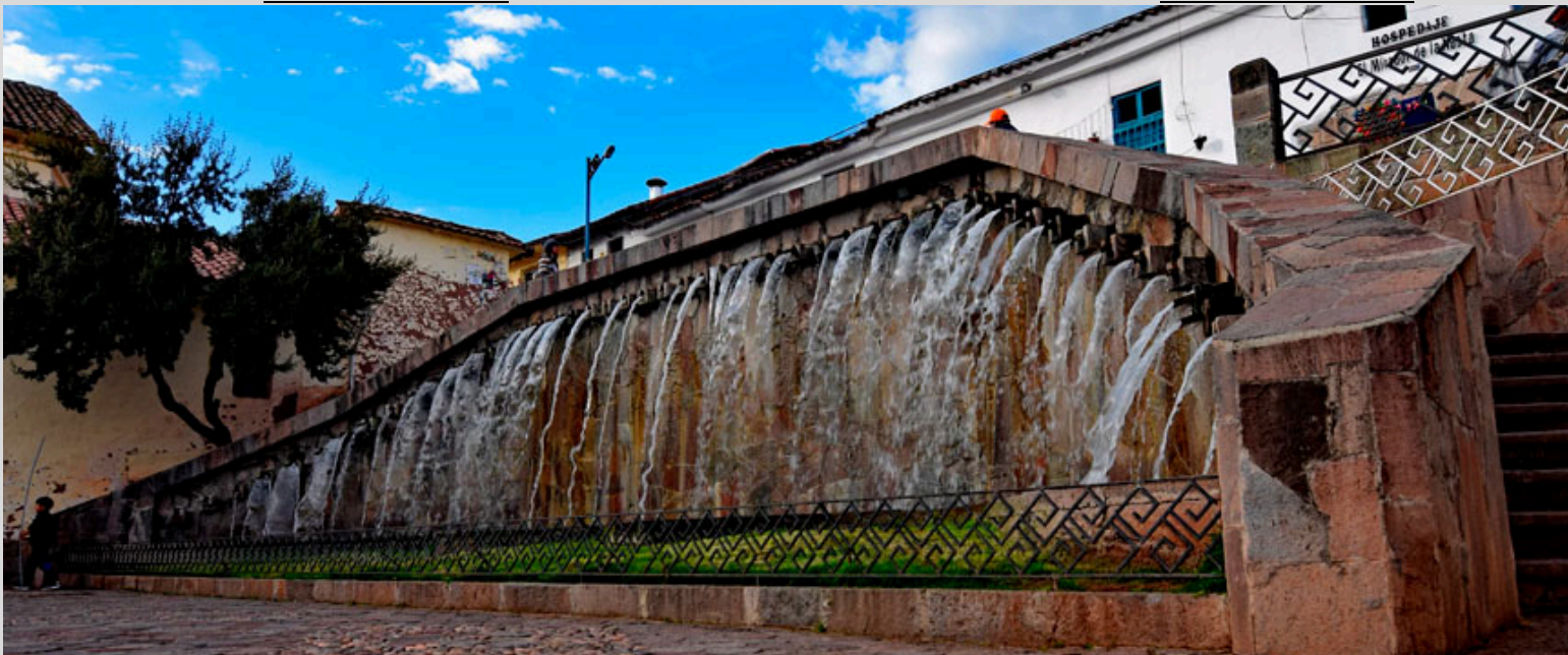
paccha de san blas