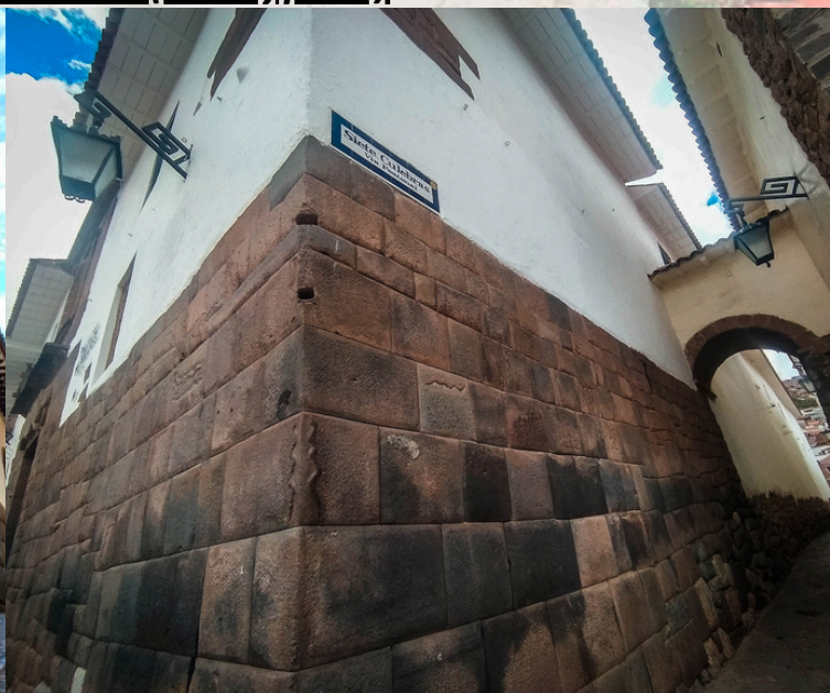
Calle 7 Culebritas