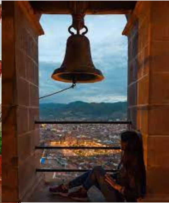
Mirador de San Cristóbal.