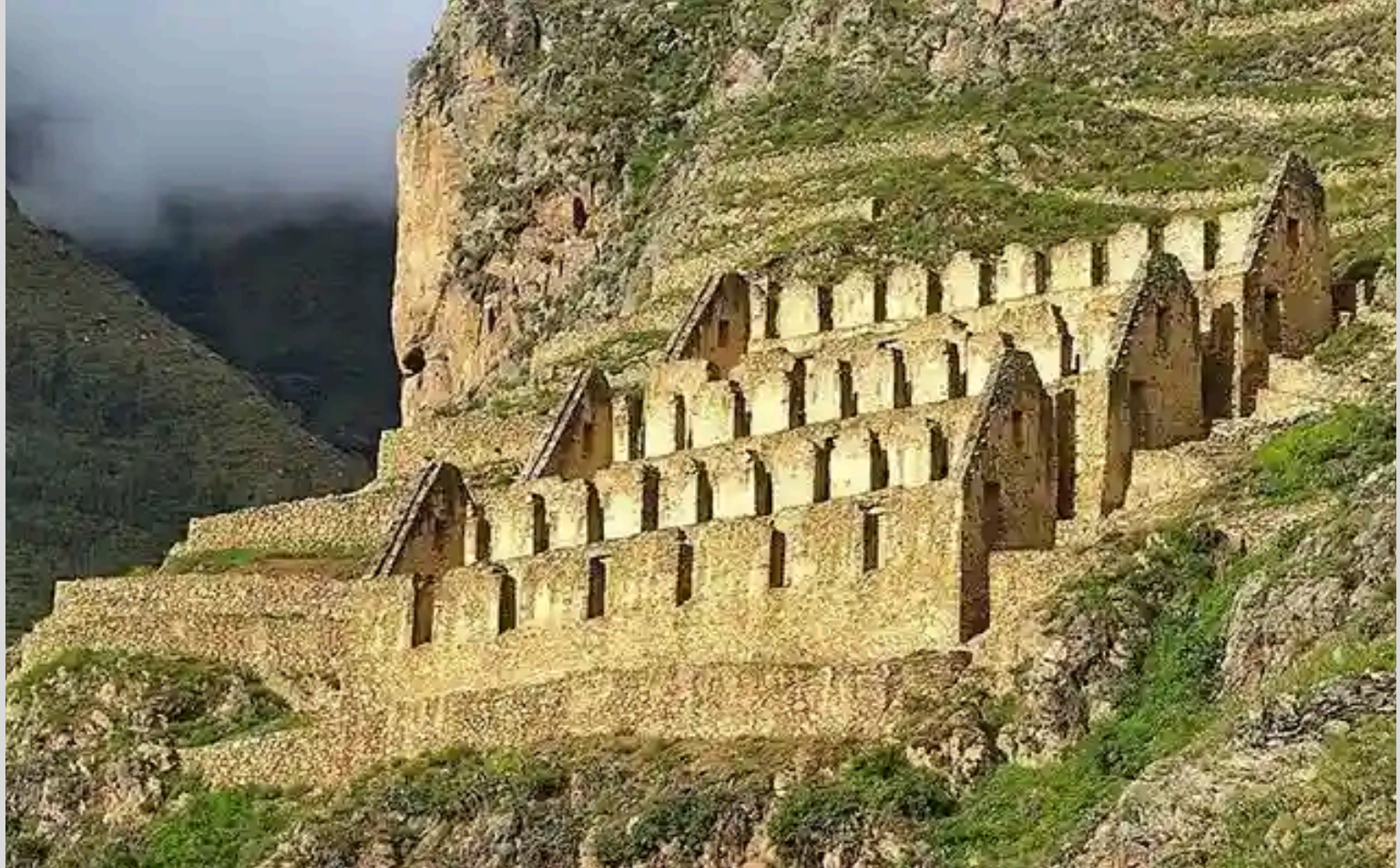
PARQUE ARQUEOLÓGICO DE OLLANTAYTAMBO