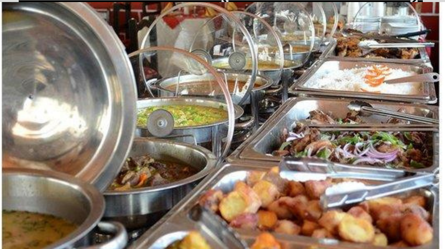
ALMUERZO BUFFET TRADICIONAL EN URUBAMBA "RUSTICO RESTAURANTE"