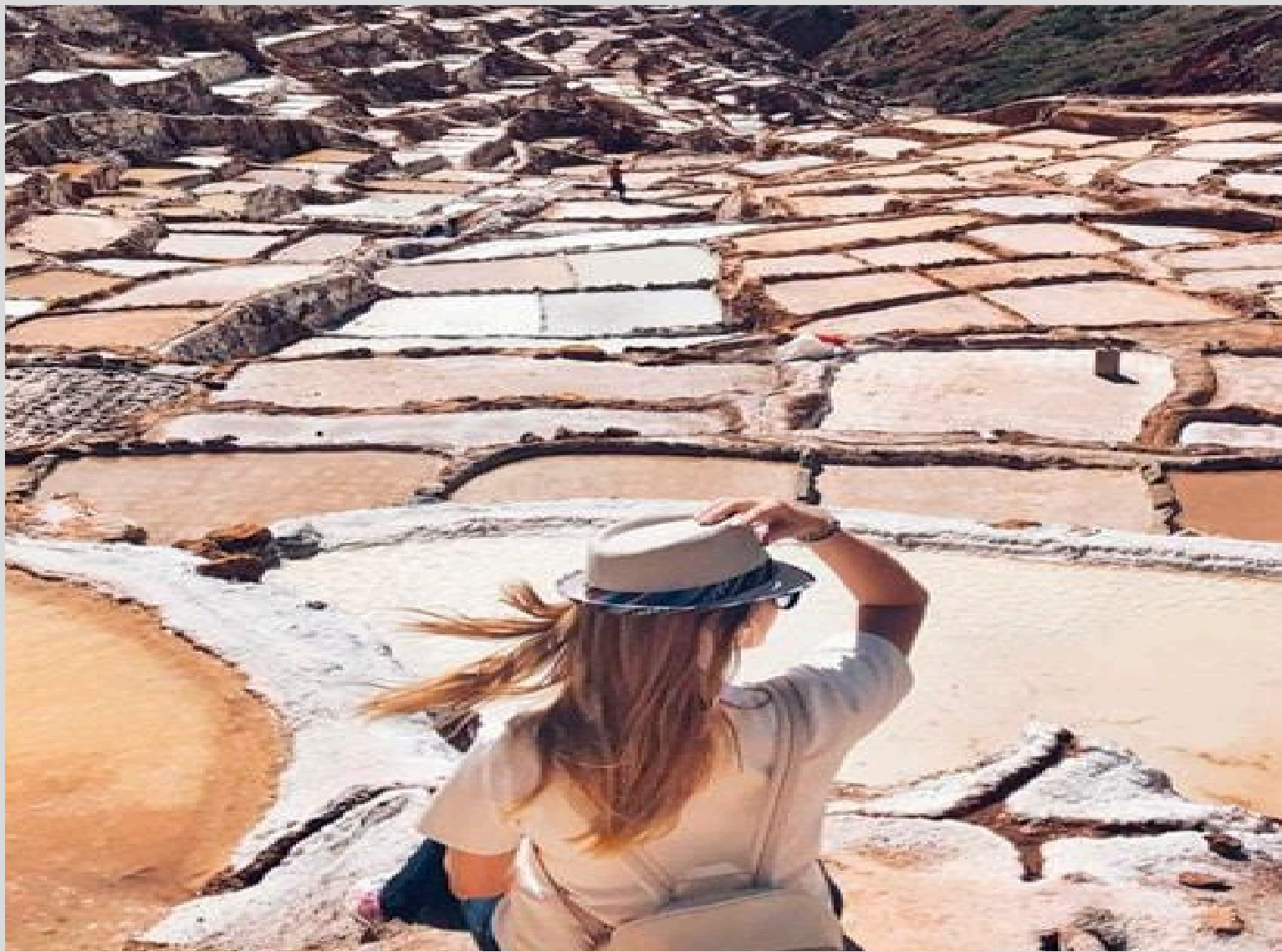
SALINERAS DE MARAS (SALES MEDICINALES)